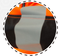
CINTAS REFLECTANTES TERMOSELLADAS DE 5 CM

Safesatis, Su diseño presenta alta preocupación de detalles y comodidad, en tus largas jornadas laborales, entregando la mejor combinación de entre calidad y confort.