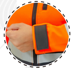
AJUSTE DE PUÑO CON VELCRO