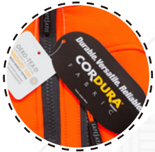
REFUERZO DE CODOS EN TELA CORDURA®