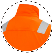
PARTE TRASERA DE CUELLO MAS ALTA PARA PROTEGER DEL FRIO Y DEL VIENTO