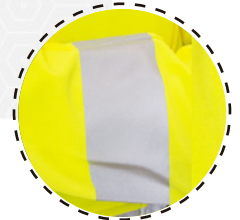
CINTAS REFLECTANTES TERMOSELLADAS DE 5 CM

Safesatis, Su diseño presenta alta preocupación de detalles y comodidad, en tus largas jornadas laborales, entregando la mejor combinación de entre calidad y confort.