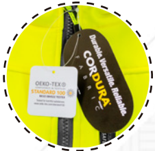
REFUERZO DE CODOS EN TELA CORDURA®