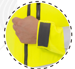
AJUSTE DE PUÑO CON VELCRO