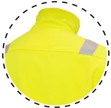
PARTE TRASERA DE CUELLO MAS ALTA PARA PROTEGER DEL FRIO Y DEL VIENTO